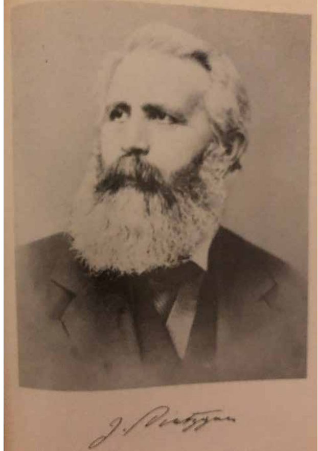
Görsel 3. Joseph Dietzgen, portre (Finger, 1977: s.48-49).

sal bakışı nedeniyle "Komünist Parti Manifestosu" nun öğretileriyle de hemfikir olan) Dietzgen için, Marx ve Engels'ten çok da bağımsız olmayan, ancak o zamanlar bilmediği Hegel'den 5) bağımsız bir şekilde materyalist diyalektiği keşfetmeyi mümkün kıldı. Dietzgen'in Marx ve Engels'ten bağımsız olduğunu söylemek, onun Marx ve Engels'in konuyla ilgili felsefi çalışmalarının tamamına hâkim olmadığı göz önünde tutulduğunda mümkün olur ancak (Kirchner, 1958). Felsefi bağımsızlığı ona eleştirilebilecek bazı belirsizlikler katsa da, politik-ekonomik konularda pek yanılmamıştı, çünkü burada Marksist çözümlere sıkı sıkıya bağlı kalıyordu.