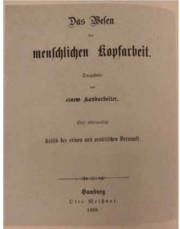
Görsel 2. "Kafa Emeğinin Özü Üzerine" kitabının kapak sayfası (Finger, 1977: s.48-49).

Delege olarak katıldığı Uluslararası İşçi Birliği'nin Eylül 1872'deki Lahey Kongresinde Karl Marx, Joseph Dietzgen'i diğer delegelere şu sözlerle tanıtmıştı: "İşte bizim filozofumuz." (Mende, 1963). Marx, konuşmasında "filozof" sözcüğünü özellikle vurgulamıştı çünkü Dietzgen'in 1869 yılında yayınlanan "Kafa Emeğinin Özü Üzerine" (Dietzgen, 1973) adlı kitabına gayet aşinaydı. Kitabın alt başlığı "Bir Zanaatkarın Tasviri", yazarın merakını etkileyici bir biçimde açıklıyordu: işçi sınıfına siyasi mücadelesi için gerekli entelektüel donanımı sağlayacak epistemolojiyi ortaya koymak. Ölümünden bir yıl önce Dietzgen, epistemolojisinin çabalarını, son büyük eseri olan "Felsefenin Kazanımı"nın (Das Acquisit der Philosophie) "Önsöz"ünde şu şekilde tanımlıyordu: "[...] Çelişkilerle dolu gerçek dünyada yolunu bulmak için kafanın aşkın boyutlara dalmasına gerek yok." (Dietzgen, 1955).