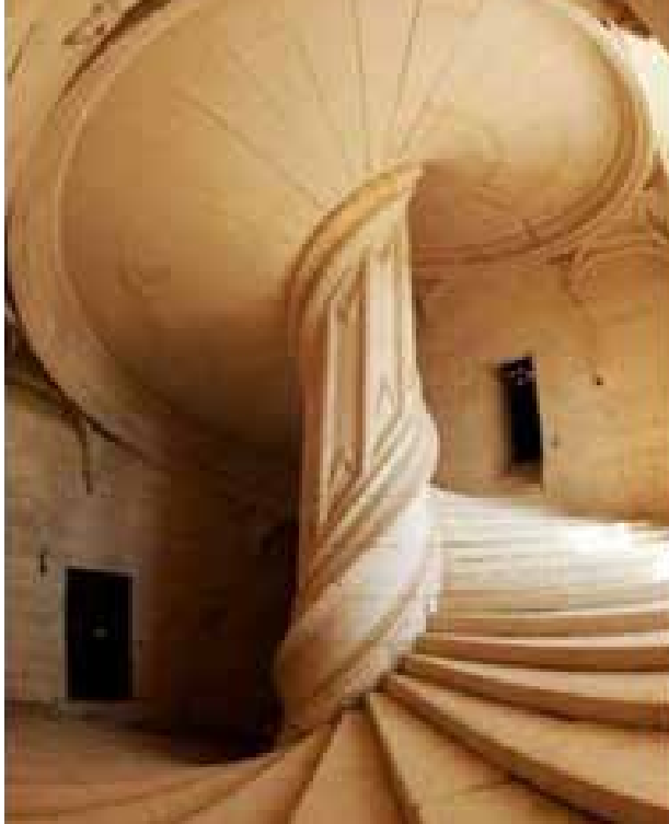
Görsel 4. Leonardo da Vinci'nin Chambord Kalesi