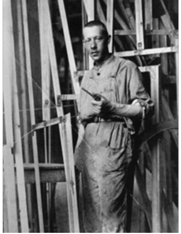
Görsel 1. Vladimir Tatlin’in Nikolay Punin tarafından çekilen anıt önündeki fotoğrafı, 1920. Kaynak: www.monoskop.org/Vladimir_Tatlin

Picasso ile görüştü. Picasso’nun atölyesini ziyaret eden Tatlin, sanatçının üç boyutlu karışık materyallerden oluşan eserleri sayesinde Kübist form analiziyle tanıştı. Bu kolaj ve montaj çalışmalarının etkisi Tatlin’in Picasso ziyaretinden hemen sonra yapmaya başladığı ve özellikle cam, metal, alçı ve ahşap gibi farklı endüstriyel malzemelerden oluşan işlerinde/yapıtlarında ortaya çıkmaktadır.