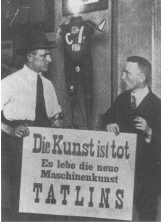
Görsel 2. Birinci Dada Festivali'nde (1920) Almanca bir pankart: "Sanat öldü. Yaşasın Tatlin'in yeni makina sanatı."

Tatlin'in, Enternasyonal'e yönelik anıt projesi olan Tatlin Kulesi malzeme, yapı ve hacim üzerine yeni bir anıtsal yaratıcılık ortaya koyarken aynı zamanda çökmekte olan sanatın yerine yeni bir yaratıcılık ve tasarım ekşininde bir atılım gerçekleştirmiştir.