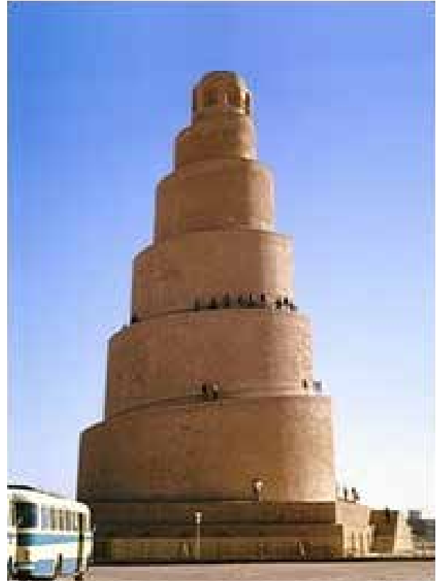
Görsel 5. Samara'daki Ulu Camii'nin minaresi.

Tarihsel olarak bu döneme kadar burgusal formlar neredeyse hiç kullanılmamıştır. Ancak Tatlin' e bu fikri vermiş olabilecek az sayıda da olsa örnekler mevcuttur. Leonardo bunlardan biridir, diğeri ise Irak Samara'daki Ulu Caminin minaresidir. Bu minare konik bir spiral şeklindedir; müezzinin merdiven basamakları olmadan dönerek yukarı çıkmasını sağlayan bir yapısı vardır (Murtinho, 2017, s. 22).